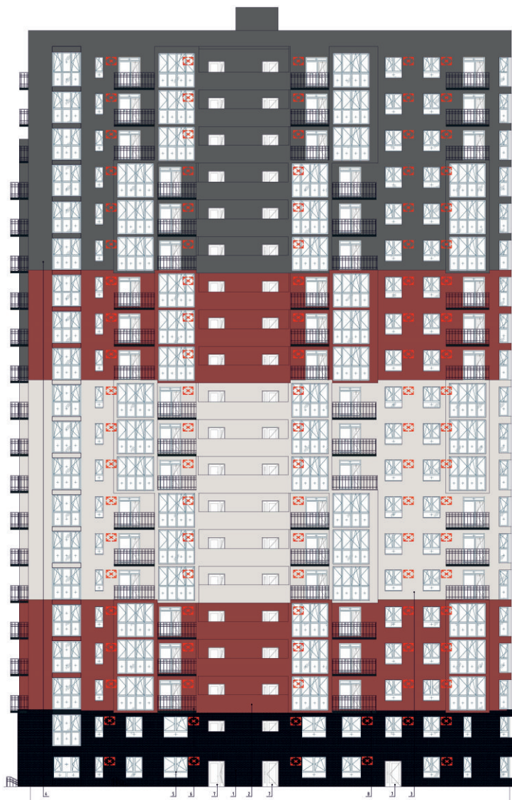
Фасад в сторону ГП-1